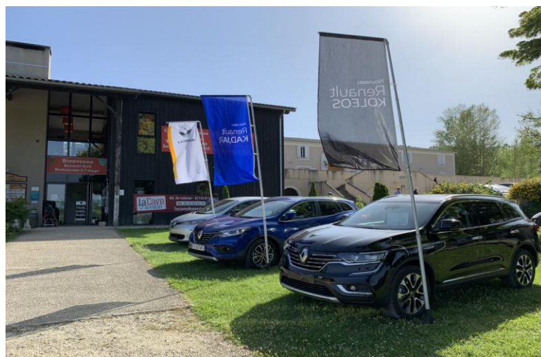
Golfy Cup - Centre Expo RENAULT

De nombreuses possibilités s'offrent à vous, selon les options et formules choisies. Prestations sur mesure si besoin.